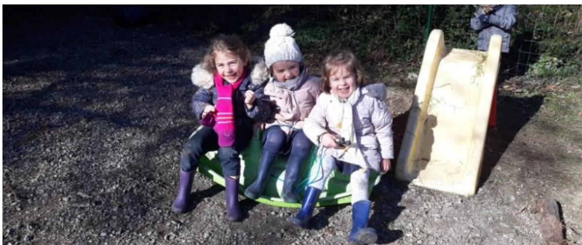
Complicité de petites filles sur la cour de récréation.