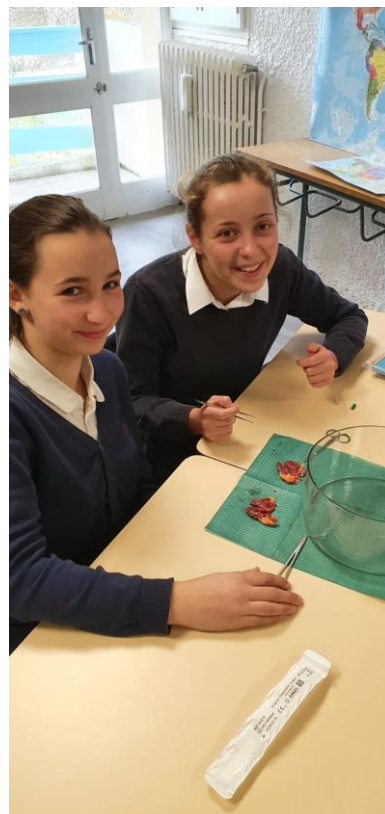
Un exercice nouveau en classe de SVT pour les 5èmes : la dissection de cœur de poulet !